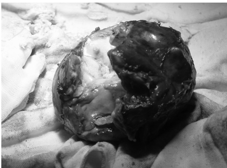
شکل ۲- کل توده برداشته شده

شکایت خاص و معاینه کاملاً نرمال، بدون لمس توده در شکم مشاهده گردید. مجدداً CT اسپیرال انجام شد که هیچ‌گونه شواهدی از توده باقیمانده یا عود را نشان نداد.