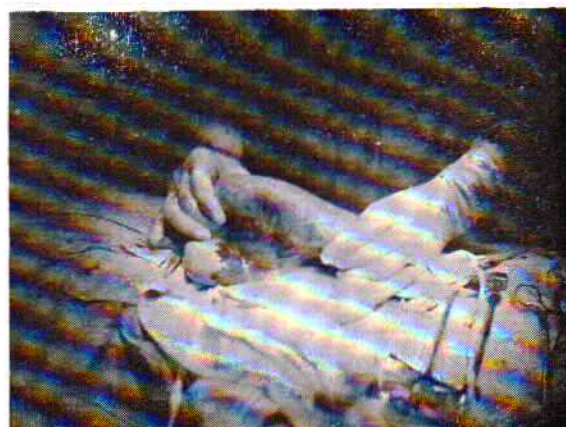
شکل ۱- روره باریک که درموقع عمل برداشته شده است.