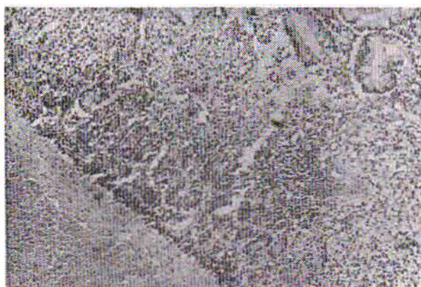
شکل ۳ و ۴- مقطع میکروسکوپی روده.