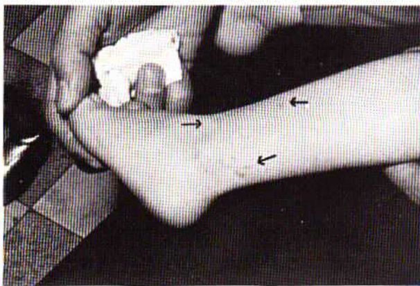
شکل (۲) - ضایعات ناشی از نوزاد جرب هگزاید یونیس اس پی

نشانه های بیماری بصورت اریتم (Erythema) آغاز می گردد و ظرف چند ساعت بدنبال آن پاپول (Wheal) سپس تاو ایجاد می شود که بسیار دردناک و توام با خارش است. متعاقباً پوستولها بشکل متمرکز یا بصورت خطی بدنبال هم ظاهر می گردند. (با بررسی مرکز این پوستولها توانستیم نوزادان جرب را مشاهده نمائیم). بتدریج بعلت خارش شدید پوست موضع سائیده شده و ترشحات اکسودانی زیادی سطح پوستول را فرا می گیرد. پوستولهای منظم خطی شکل در اطراف میچ دست و پا و کمر و ناحیه شکم و نشیمنگاه مشاهده شد که اکثر موارد این پوستولها در اطراف کمر و یا ساقه جوراب واقع شده بودند (شکل ۲).