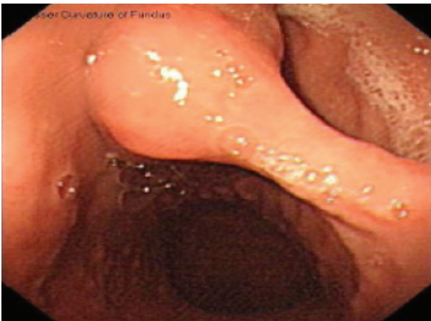
شکل ۱. اندوسکوپی یک پولیپ بزرگ پدانکوله در قسمت میانی انحنای بزرگ معده را نشان میدهد

سانتیمتر که از بخش پایه گرفته شد با موفقیت بدون خونریزی بعدی انجام گرفت. معاینه هیستولوژیک ضایعه نشان داد که ضایعه پولیپوئید خارج شده دارای اندازه 2/5 \times 1/5 \times 1/5 سانتیمتر و با ساقه کوتاه بود. در قطعات بریده شده بافت، تعدادی از کیست‌های پر شده از مومین کوچک با زمینه استرومای مایل به صورتی مشاهده شد. معاینه میکروسکوپی سطح پولیپ، موکوس نوع آنترال با متابلازی فوکال سلول‌های گابلت و التهاب مزمن متوسط را نشان داد. در عمق پولیپ‌ها تعدادی غدد کیستیک در باندهای غیرارگانیزه و متراکم از عضلات صاف موسکولاریس موکوزا قرار گرفته بودند. این غدد حاوی اپی تلیوم صاف یا گلاندولار بودند و توسط یک حاشیه لامینا پروپریا احاطه شده بودند. دیسپلازی یا بدخیمی در ضایعه مشخص نشد و در نهایت تشخیص پاتولوژی گاستریت پولیپوز سیستیک GCP داده شد (شکل ۳ a و b).