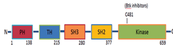
شکل ۱: ساختار ژن BTK (۱۶)