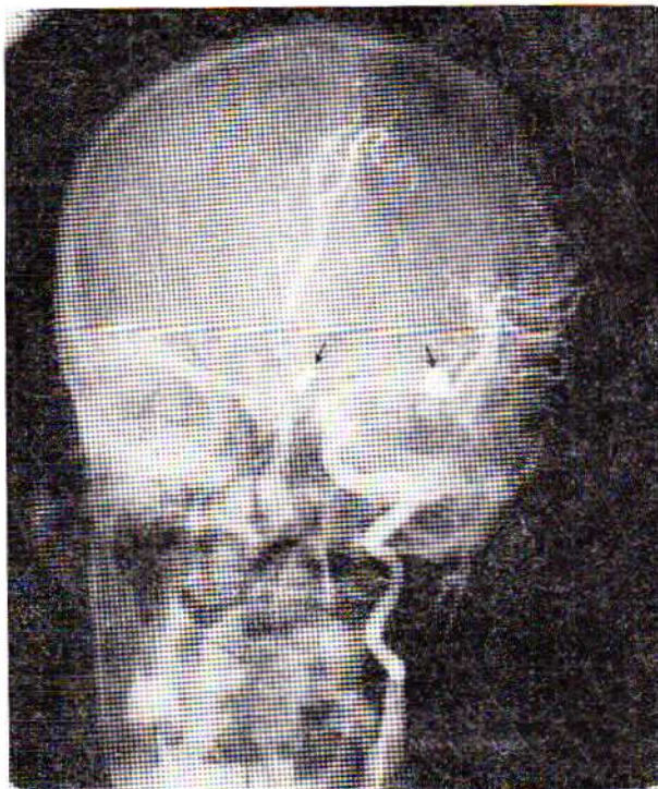
شکل ۳ - در این شکل روی دستکاه کاروتید راست دو آنوریسم دیده میشود یکی روی شریان مغزی میانی و دیگری روی شریان رابط قدامی

جدار آنوریسم از نسج ملتحمه درست شده و در محل اتصالش به جدار سالم شریان ، پرده الاستیکی داخلی موجود نیست ضمناً طبقه عضلانی قعر کیسه آنوریسم خیلی نازک شده و گاهی از بین رفته است ولی انتیما ( Intima ) برعکس ضخیم شده جای نسج عضلانی را میگیرد . از این رو هر آنوریسمی دو نقطه ضعف دارد یکی قعر کیسه آنوریسم و دیگری محل اتصال آنوریسم به شریان ، در داخل آنوریسم نسج ترومبوزه دیده شده و جدار داخلش را