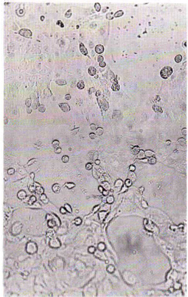
شکل شماره ۳- سلول آمیبون روز ششم پس از تزریق ویروس.