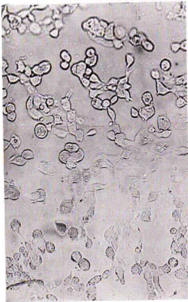
شکل شماره ۴- سلول آمیبون روز نهم پس از تزریق ویروس.

تیپهای ۳ و ۴ و ۷ و ۸ میباشند. اگر چه عفونت با آدنوویروسها در اشخاص بالغ دارای پیش آگهی خوب است ولی در کودکان پنومونی‌های شدید و کشنده بعلمت این ویروسها توسط چنی Chany وهمکاران او و دیگران گزارش شده است (۶ و ۱۰ و ۱۱). همچنین مننژیت بعلمت آدنوویروس توسط فالکنر و رویان ذکر شده است (۱۲). در اپیدمی بررسی شده در بیمارستان کودکان مسعودی تنها کودکانی را در نظر گرفتیم که دارای علائم واضح عفونت با این ویروس بودند، این علائم عبارت بود از تب، اسهال کنژنکتیویت، بثورات جلدی و ضایعات دستگاه تنفسی. بطور مسلم در میان سایر کودکان بستری شده در بیمارستان، در زمان بروز این اپیدمی، تعداد دیگری از کودکان مبتلا به عفونت خفیف با این ویروس شده‌اند، یعنی چند روزی تب کرده و یا علائم ضعیف یک سرماخوردگی را نشان داده‌اند.