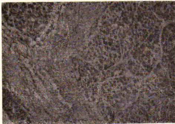
شکل شماره ۶- ط . ب . سیروز پست نکروتیک با هپاتوبلاستوم دو توده نومورال که توسط نسج هم بندی کلاژنی ضخیم از هم جدا شده‌اند .

ضایعات کلیوی شامل يك مورد سندرم نفروتیک با ضایعات اندک با سیر سه ساله و يك مورد گلو مریولوپاتی مامبرانو پریولیفرا تیف