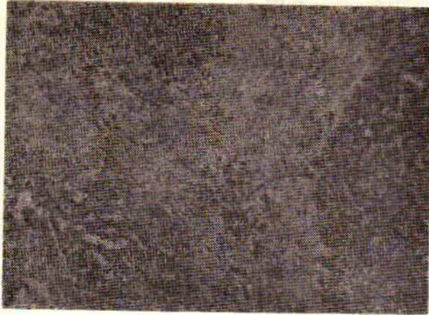
شکل شماره ۳- سیروز ماکرونودولی پست نکروتیک. نودولهای ریز و درشت توسط دیواره‌های هم بندی متراکم و ضخیم از هم جدا شده‌اند.

دست آوردهای آسیب‌شناسی در ۵۷ مورد بشرح زیر بوده است : سیروز میکرونودلی با استئاتوز شدید سه مورد ( شکل ۳ ) ، سیروز میکرونودولی سی‌وسه مورد ( شکل ۴ ) ، سیروز ماکرونودولی و پست نکروتیک ۲۱ مورد ( شکل ۵ ) . در سه مورد از گروه اخیر التهاب شدید و ضایعات پیشرفته سلولهای کبیدی ( هپاتوسیت ) در نسج کبد مشاهده نشد .