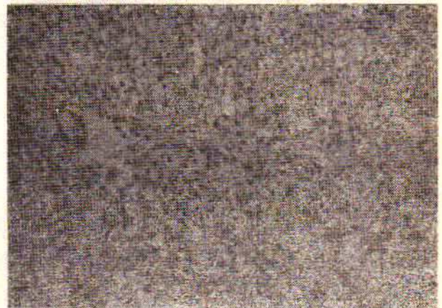
شکل شماره ۴- سیروز تغذیه‌ای . هپاتوسیتها از واکوئول چربی انباشته است دیواره هم بندی ظریف ورید مرکز لوبولی را به فضای پورتال وصل کرده است.

نزد ۸ بیمار نشانه‌های پرتونگاری سل وجود داشت. در دو مورد گرآنولهای سلی در بین ضایعات سیروز کبیدی مشاهده شد . در کالبد گشائی یکی از این دو بیمار سل احشائی منتشر با آمیلوئیدوز کلیوی نیز همراه بود . نزد بیمار دیگری سیروز با هپاتوبلاستوم همراه بود. این بیمار دختر ۱۲ ساله‌ای است که با علائم سیروز و افزایش فشار ورید باب بستری شد و سنتی گرافی کبد وجود حفره بزرگی را تأیید کرد ( شکل ۲ ) . بیمار بعلت خونریزی‌های شدید گوارشی در گذشت و در کالبد گشائی چند نوع ضایعه وجود داشت: سیروز ماکرونودولی پست نکروتیک ، کانوهای متعدد هپاتوبلاستوم با متاستاز در وریدهای ریوی و کانون سل کازمودریه ( شکل ۶ ) .