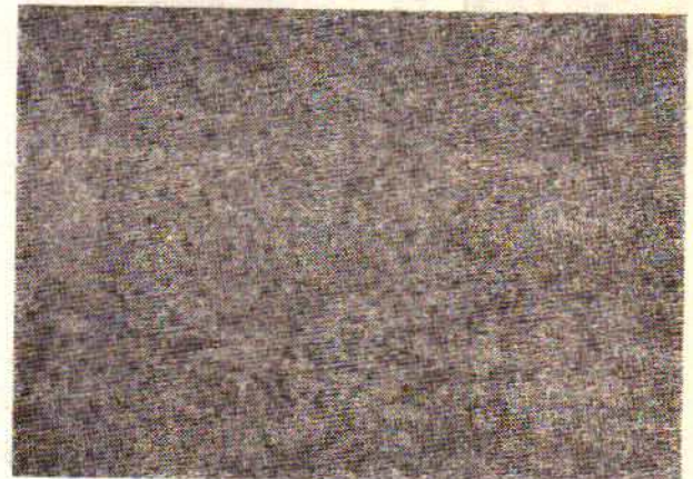
شکل شماره ۶- سیروز پورتال ( میکرونودولی ) . نودولهای کوچک پارانشیم کبد توسط دیواره‌های ظریف هم بندی که حاوی لوکوسیت‌های تک هسته‌ای است از هم جدا شده‌اند .