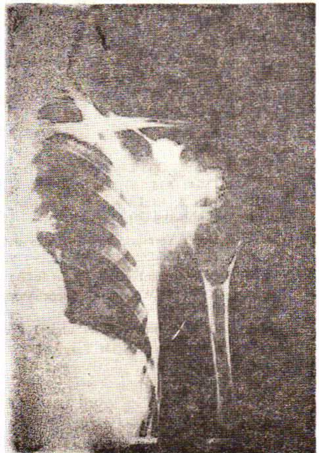
پرتونگاری شماره ۴ - م - ح - نمره ۱