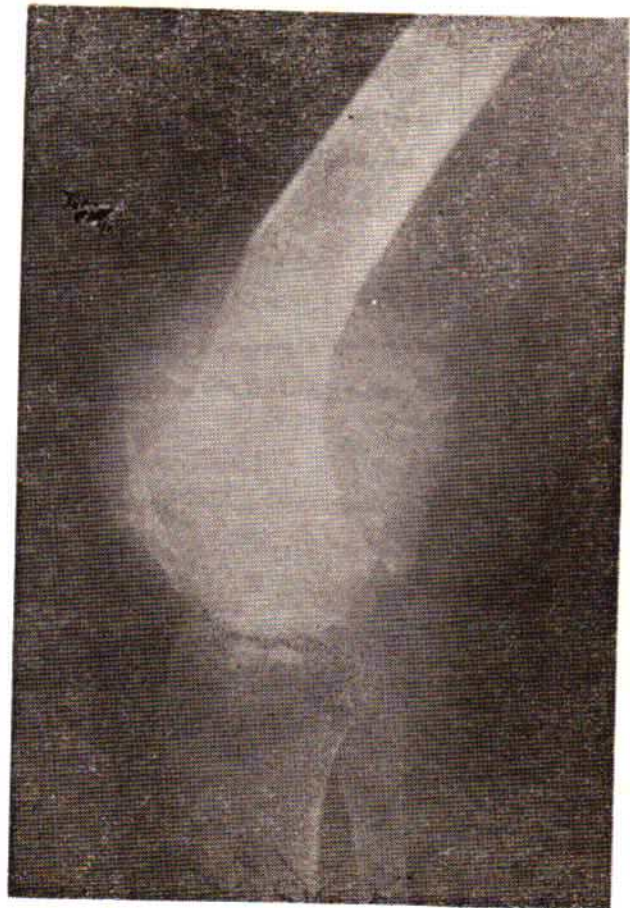
پرتونگاری شماره يك - ا - م