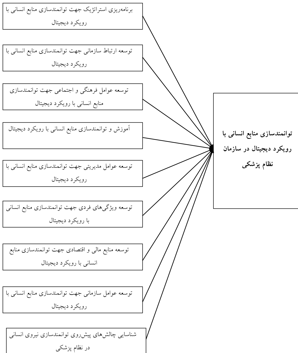
شکل ۱. مدل نظری پژوهش