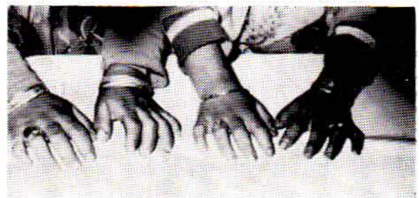
شکل شماره ۴- دستهای دو بیمار