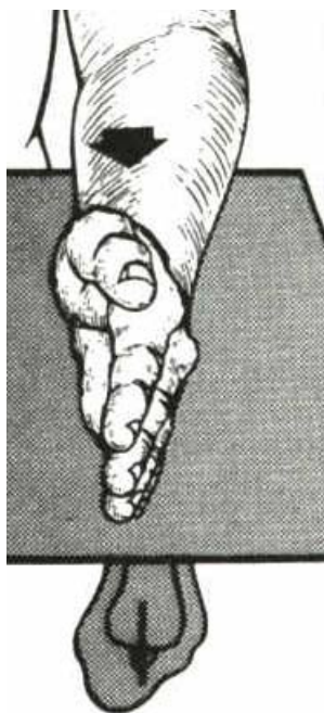
رادیوگرافی نیم رخ