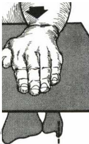
رادیوگرافی رخ ( پوستر و آنتریور )