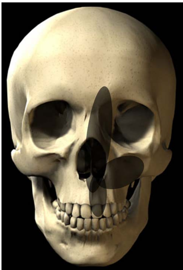
عکس شماره ۶