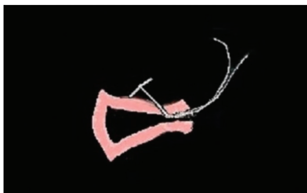
شکل ۳. تصویر شماتیک از جایگزینی نامناسب آی یودی در محل اسکار سزارین.

داخل میومتر و از آنجا به حفره صفاقی متغیر می باشد (۱۱ و ۱۲). سونوگرافی نخستین روش تصویربرداری برای ارزیابی محل قرار گیری آی یو دی در حفره رحم و همچنین بررسی عوارض مربوط به آی یو دی می باشد و شامل تشخیص در زمینه ی محل قرارگیری، ورود به داخل میومتر، سوراخ شدن رحم و بارداری داخل یا خارج رحمی به همراه آی یو دی می شود (۱۳). در سونوگرافی، به طور طبیعی آی یو دی در حفره آندومتر دیده می شود. محل درست قرار گیری آی یو دی در حفره رحم، بدون در نظر گرفتن شکل آن بدین ترتیب است که آی یو دی بین سوراخ داخلی سرویکس و ناحیه فوندال کانال آندومتر قرار گیرد. در سونوگرافی، آی یو دی دارای سایه آکوستیک خلفی و اکوژنیسیته متغیر می باشد. جایگذاری نامناسب آی یو دی (malpositioned) سبب کاهش کارایی آن بعنوان وسیله جلوگیری از حاملگی می شود و علاوه بر آن، خصوصا در زمان نزدیکی جنسی ایجاد درد می کند (۱۳). سونوگرافی دو بعدی نسبت به سه بعدی، ممکن است دو بازوی آی یو دی را به خوبی نشان ندهد. در نتیجه ممکن است قرار گرفتن نامناسب آی یو دی تشخیص داده نشود (۱۴). در حالیکه نمای کرونال در سونوگرافی سه