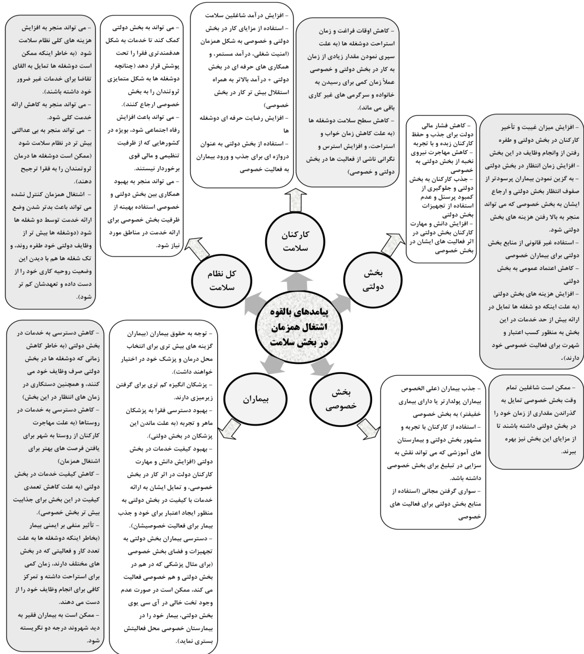
شکل ۲- پیامدهای مثبت و منفی بالقوه اشتغال همزمان بر بیماران، کارکنان سلامت، بخش دولتی، بخش خصوصی، و کل نظام سلامت (ستون های خاکستری مربوط به پیامدهای بالقوه منفی، و ستون های سفید مربوط به پیامدهای بالقوه مثبت می باشد).

سلامت، و عدالت و برابری در سلامت طبقه بندی گردیده و مورد بحث و بررسی بیشتر قرار خواهند گرفت.