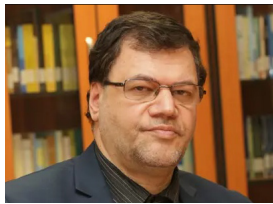
رئیس افتخاری همایش: دکتر باقر لاریجانی